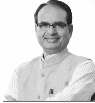
शिवराज सिंह चौहान, मुख्यमंत्री